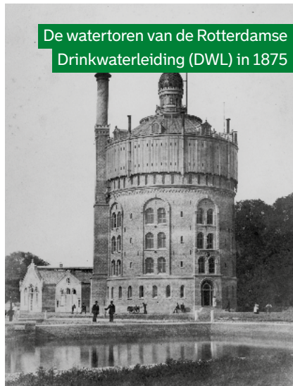
De watertoren van de Rotterdamse Drinkwaterleiding (DWL) in 1875

Een Engelse arts had al in 1854 aangetoond dat zulke ziekten door drinkwater werden verspreid. Maar in Nederland twijfelden veel deskundigen hieraan. Pas tijdens de cholera-epidemie van 1866-1867 werd een staatscommissie ingesteld. Hierna