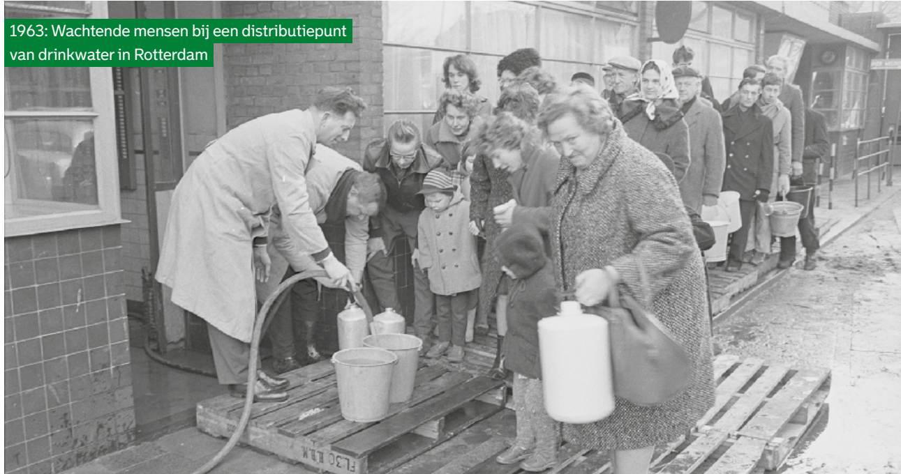
1963: Wachtende mensen bij een distributiepunt van drinkwater in Rotterdam